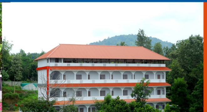
PAVANATMA HOSTEL FOR LADIES