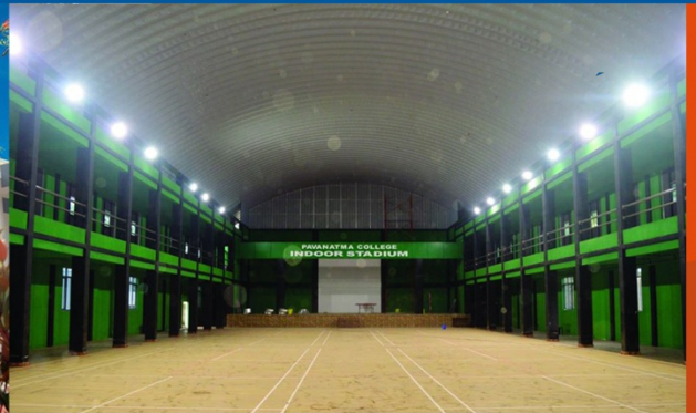
COLLEGE INDOOR STADIUM